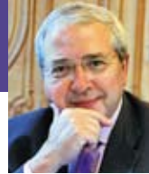
Jean-Paul Huchon Président du conseil régional d'Île-de-France

Décider de son avenir n'a pas de prix. Les formations professionnelles financées par la Région Île-de-France sont de très grande qualité. Votre organisme est là pour vous accompagner à chaque étape de votre formation. Votre conseiller emploi est toujours à votre écoute. Mais au final, votre meilleur allié, ce sera toujours vous-même. Ce sont vos choix personnels qui feront toute la différence. Alors, bonne lecture pour mettre toutes les chances de votre côté!